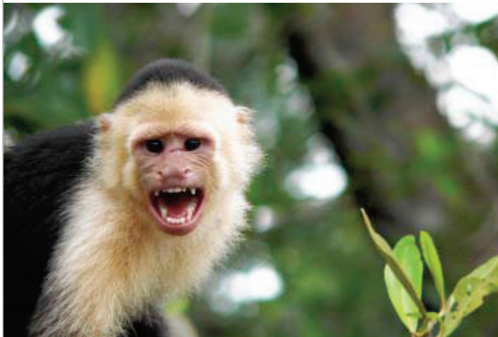
Den lille drillesyge capuchineraber er en dristig tasketyv.