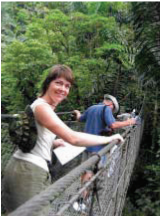
Hængebroerne i regnskoven ved vulkanen Arenal giver en god udsigt.