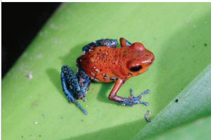
T.V. Nok er den fascinerende, Blue Jeans-frøen, på størrelse med en tommelfingernegl. Men rør ikke den giftige fætter.