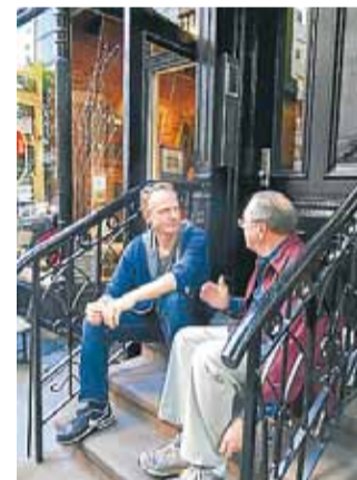
TID TIL en snak på trappestenen med naboen.